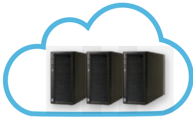
RISCO Cloud Server